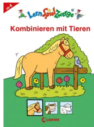
LernSpielZwerge - Kombinieren mit Tieren Taschenbuch