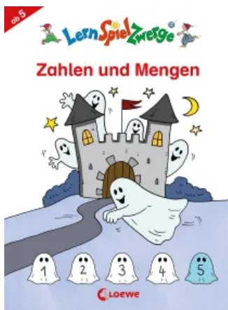
LernSpielZwerge - Zahlen und Mengen Taschenbuch