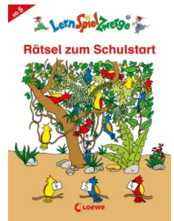
LernSpielZwerge - Rätsel zum Schulstart Taschenbuch