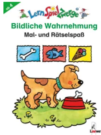
Bildliche Wahrnehmung Unbekannt