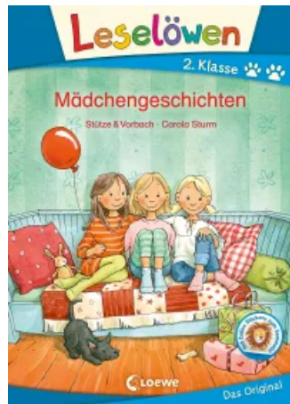
Leselöwen 2. Klasse - Mädchengeschichten Hardcover