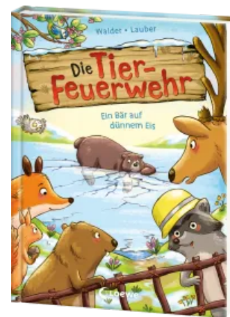
Die Tier-Feuerwehr (Band 3) - Ein Bär auf dünnem Eis Hardcover