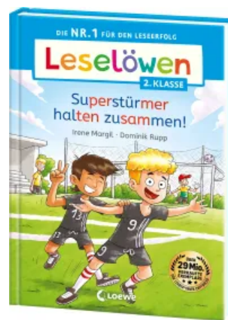
Leselöwen 2. Klasse - Superstürmer halten zusammen! Hardcover