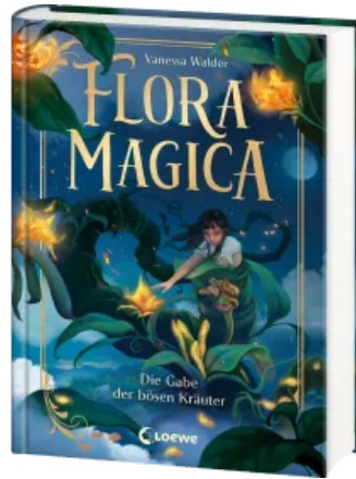
Flora Magica (Band 2) - Die Gabe der bösen Kräuter Hardcover