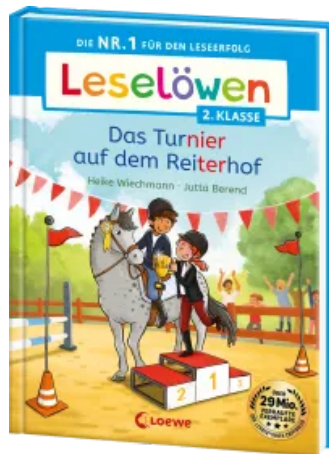
Leselöwen 2. Klasse - Das Turnier auf dem Reiterhof Hardcover