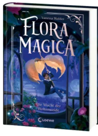
Flora Magica (Band 3) - Die Macht der Weltenweide Hardcover