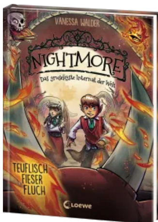
Nightmore - Das gruseligste Internat der Welt (Band 3) - Teuflich fieser Fluch Hardcover