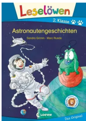
Leselöwen 2. Klasse - Astronautengeschichten Hardcover