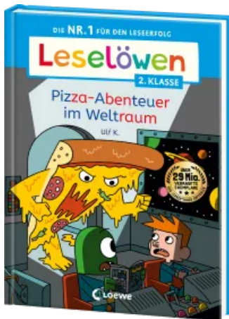
Leselöwen 2. Klasse - Pizza- Abenteuer im Weltraum Hardcover