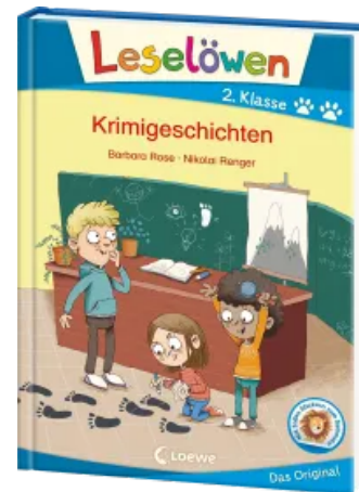
Leselöwen 2. Klasse - Krimigeschichten Hardcover