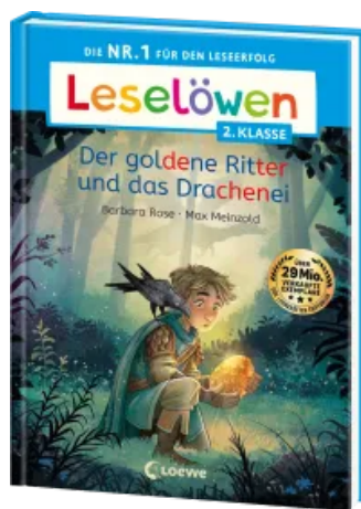
Leselöwen 2. Klasse - Der goldene Ritter und das Drachenei Hardcover