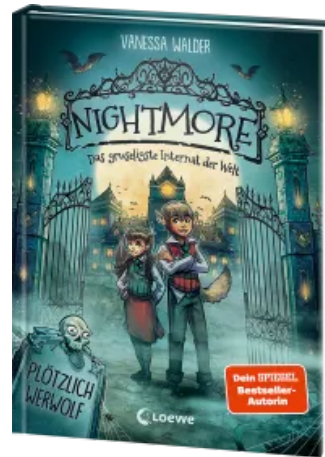
Nightmore - Das gruseligste Internat der Welt (Band 1) - Plötzlich Werwolf Hardcover