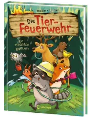
Die Tier-Feuerwehr (Band 1) - Ein Waschbär greift ein Hardcover