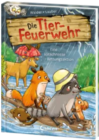
Die Tier-Feuerwehr (Band 2) - Eine klitschnasse Rettungsaktion Hardcover