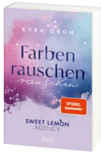
Farben rauschen (Sweet Lemon Agency, Band 2) Paperback