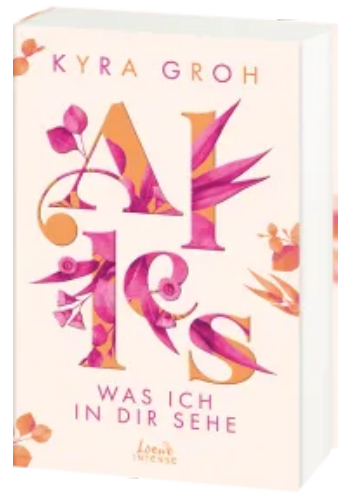
Alles, was ich in dir sehe (Alles-Trilogie, Band 1) Paperback