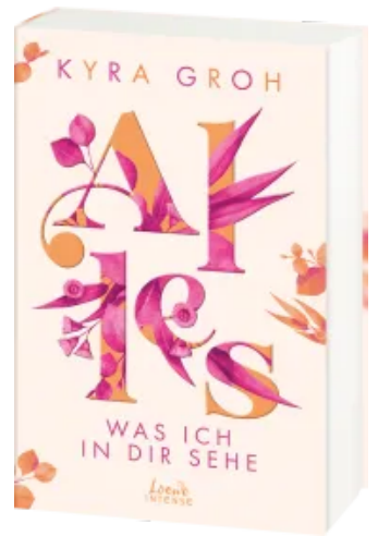
Alles, was ich in dir sehe (Alles-Trilogie, Band 1) Paperback