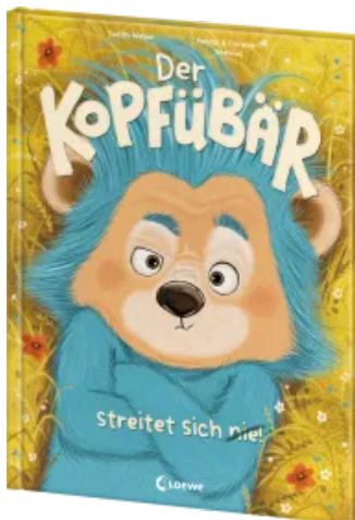
Der Kopfübär streitet sich nie! Hardcover