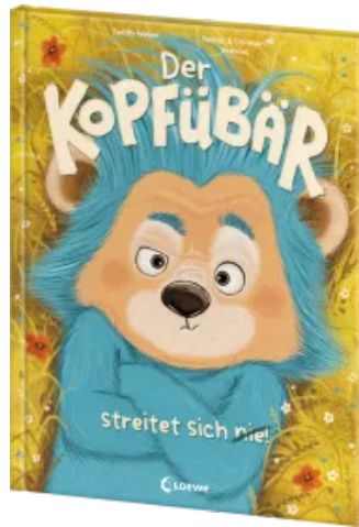
Der Kopfübär streitet sich nie! Hardcover