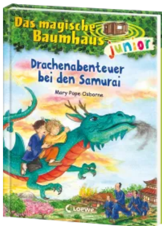
Das magische Baumhaus junior (Band 34) - Drachenabenteuer bei den Samurai Hardcover