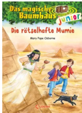
Das magische Baumhaus junior (Band 3) - Die rätselhafte Mumie Hardcover