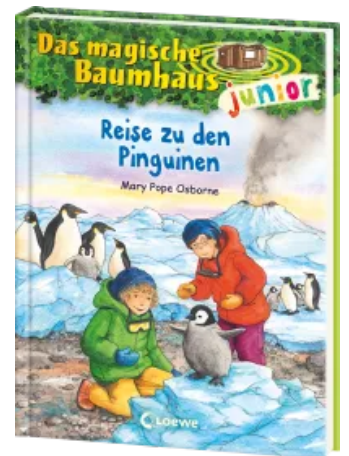
Das magische Baumhaus junior (Band 37) - Reise zu den Pinguinen Hardcover