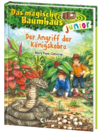
Das magische Baumhaus junior (Band 39) - Der Angriff der Königs cobra Hardcover