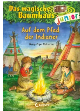
Das magische Baumhaus junior (Band 16) - Auf dem Pfad der Indianer Hardcover