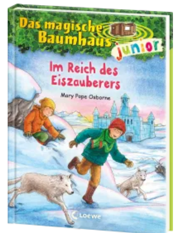
Das magische Baumhaus junior (Band 29) - Im Reich des Eiszauberers Hardcover