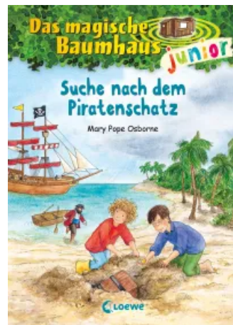
Das magische Baumhaus junior (Band 4) - Suche nach dem Piratenschatz Hardcover