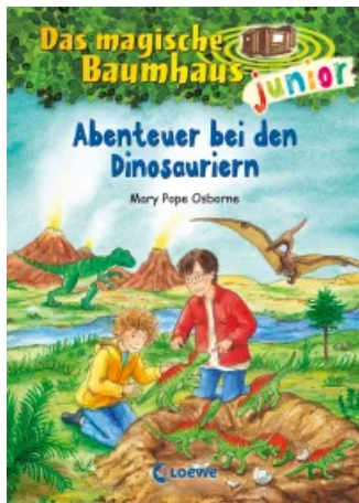
Das magische Baumhaus junior (Band 1) - Abenteuer bei den Dinosauriern Hardcover