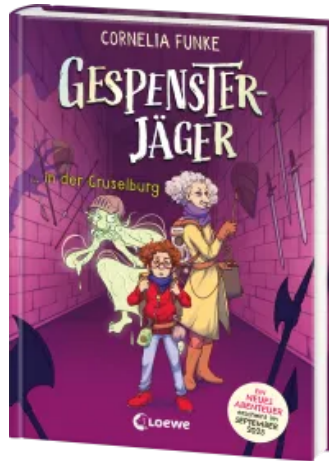
Gespensterjäger in der Gruselburg (Band 3) - Mit 8 neu illustrierten Farbseiten Hardcover