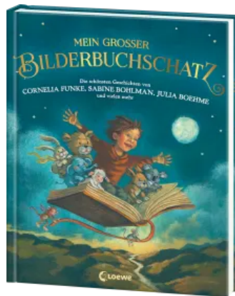
Mein großer Bilderbuchschatz Hardcover