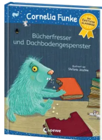
Bücherfresser und Dachbodengespenster Hardcover