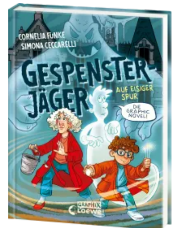
Gespensterjäger auf eisiger Spur (Band 1) - Die Graphic Novel Hardcover