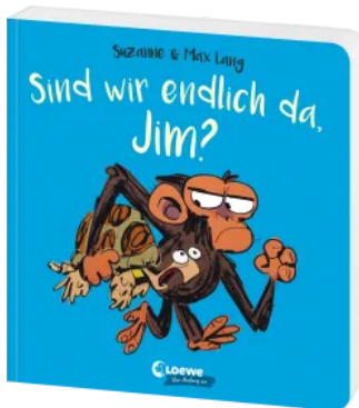
Sind wir endlich da, Jim? Hardcover