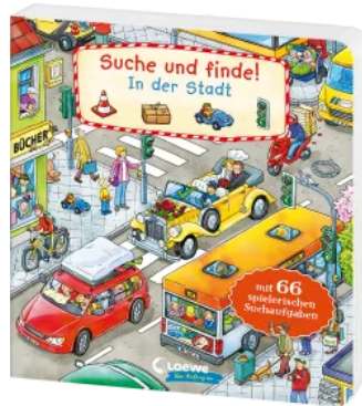
Suche und finde! - In der Stadt Hardcover