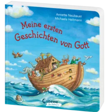
Meine ersten Geschichten von Gott Hardcover