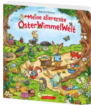
Meine allererste OsterWimmelWelt Hardcover