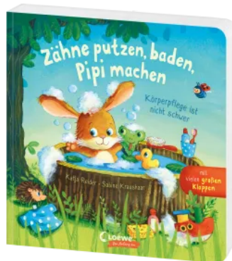
Zähne putzen, baden, Pipi machen - Körperpflege ist nicht schwer Hardcover