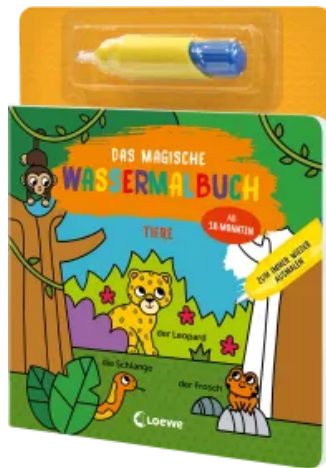
Das magische Wassermalbuch - Tiere Hardcover