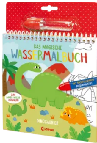
Das magische Wassermalbuch - Dinosaurier Hardcover