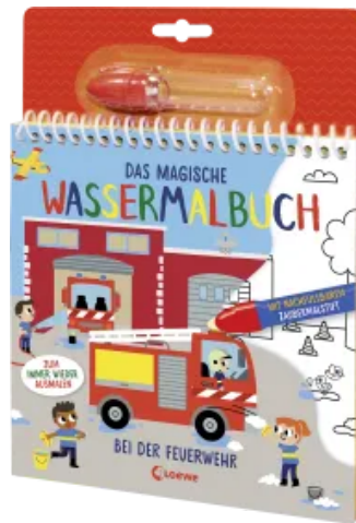
Das magische Wassermalbuch - Bei der Feuerwehr Hardcover