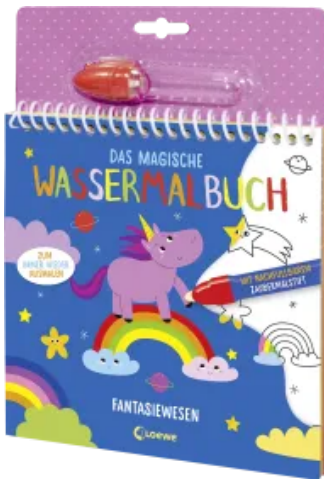
Das magische Wassermalbuch - Fantasiewesen Hardcover