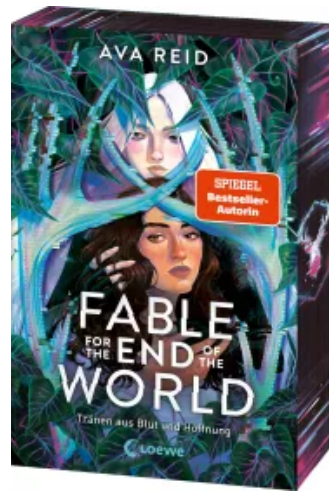
Fable for the End of the World Paperback