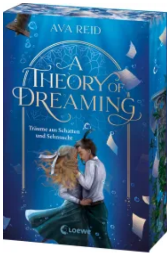
A Theory of Dreaming (A Study in Drowning, Band 2) Paperback