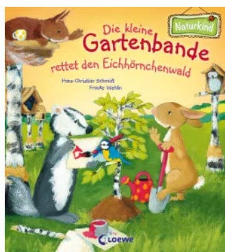
Die kleine Gartenbande rettet den Eichhörnchenwald Unbekannt