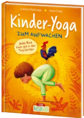
Kinder-Yoga zum Aufwachen Hardcover