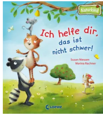
Ich helfe dir, das ist nicht schwer! Hardcover