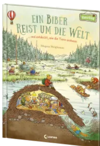
Ein Biber reist um die Welt ... und entdeckt, wie die Tiere wohnen Hardcover