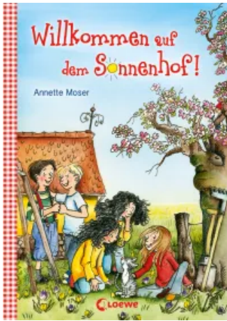
Willkommen auf dem Sonnenhof! Hardcover