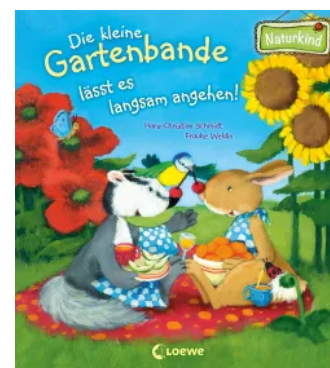
Die kleine Gartenbande lässt es langsam angehen! Unbekannt