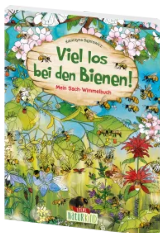
Viel los bei den Bienen! Hardcover