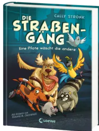
Die Straßengäng (Band 1) - Eine Pfote wäscht die andere Hardcover