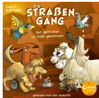
Die Straßengäng (Band 2) - Gut getrickst ist halb gewonnen Hörbuch