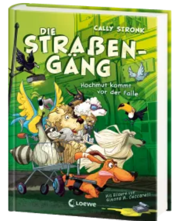
Die Straßengäng (Band 3) - Hochmut kommt vor der Falle Hardcover