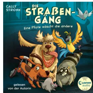
Die Straßengäng (Band 1) - Eine Pfote wäscht die andere Hörbuch