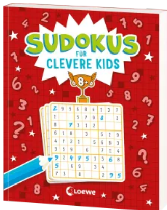
Sudokus für clevere Kids 8+