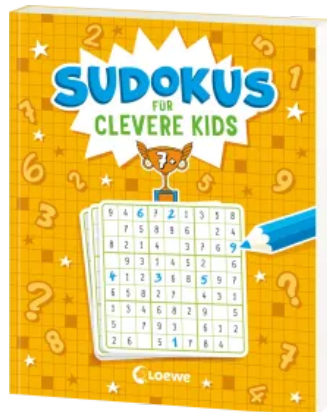
Sudokus für clevere Kids 7+