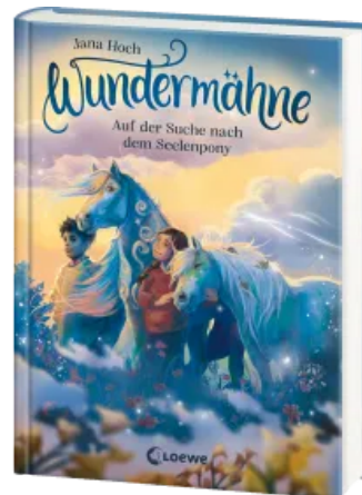
Wundermähne (Band 2) - Auf der Suche nach dem Seelenpony Hardcover