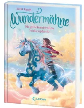
Wundermähne (Band 5) - Die geheimnisvollen Wolkenpferde Hardcover