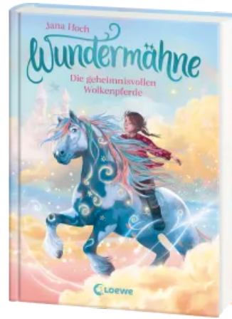
Wundermähne (Band 5) - Die geheimnisvollen Wolkenpferde Hardcover