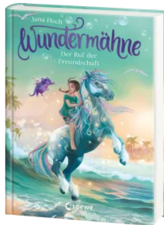
Wundermähne (Band 3) - Der Ruf der Freundschaft Hardcover