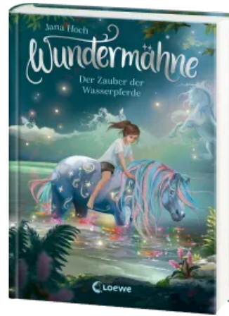
Wundermähne (Band 6) - Der Zauber der Wasserpferde Hardcover