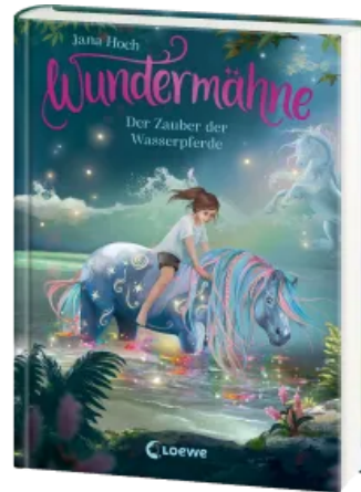
Wundermähne (Band 6) - Der Zauber der Wasserpferde Hardcover