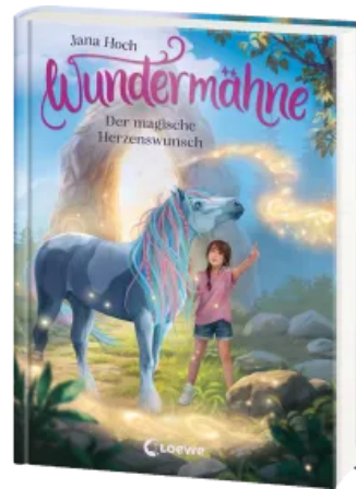
Wundermähne (Band 7) - Der magische Herzenswunsch Hardcover