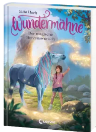
Wundermähne (Band 7) - Der magische Herzenswunsch Hardcover