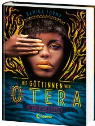
Die Göttinnen von Otera (Band 2) - Purpur wie Rache Hardcover