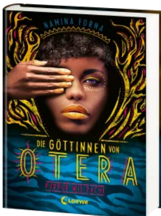
Die Göttinnen von Otera (Band 2) - Purpur wie Rache Hardcover