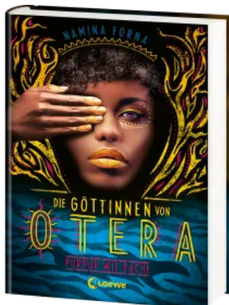
Die Göttinnen von Otera (Band 2) - Purpur wie Rache Hardcover