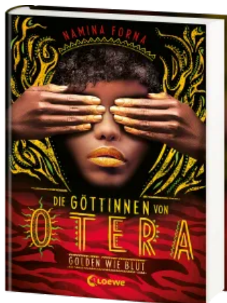
Die Göttinnen von Otera (Band 1) - Golden wie Blut Hardcover