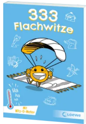
333 Flachwitze Taschenbuch