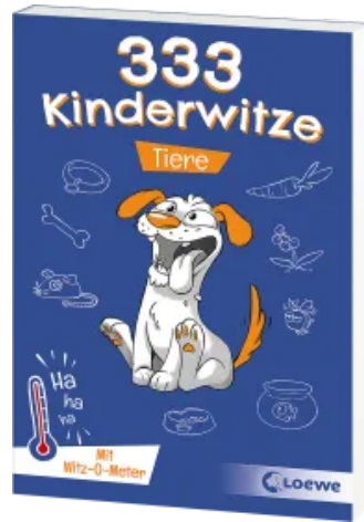
333 Kinderwitze - Tiere Taschenbuch