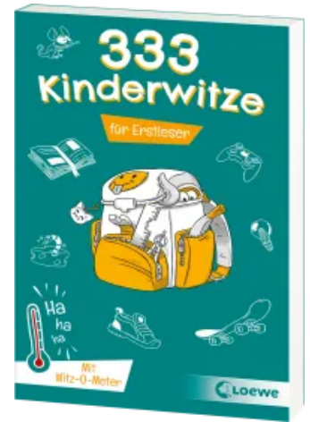
333 Kinderwitze - Für Erstleser Taschenbuch