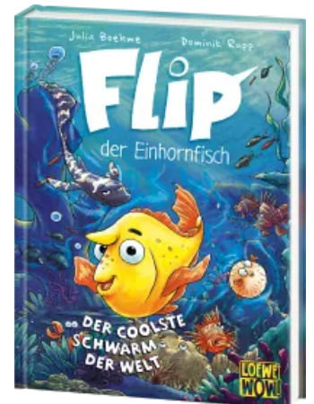
Flip, der Einhornfisch (Band 1) - Der coolste Schwarm der Welt Hardcover