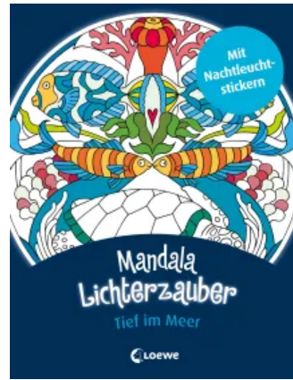
Mandala-Lichterzauber - Tief im Meer Taschenbuch