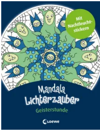
Mandala-Lichterzauber - Geisterstunde Taschenbuch