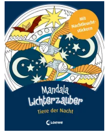
Mandala-Lichterzauber - Tiere der Nacht Taschenbuch