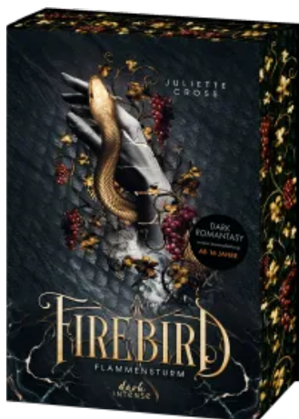
Flammensturm (Band 1) - Firebird Hardcover