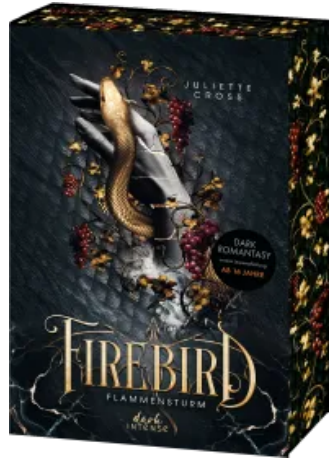
Flammensturm (Band 1) - Firebird Hardcover