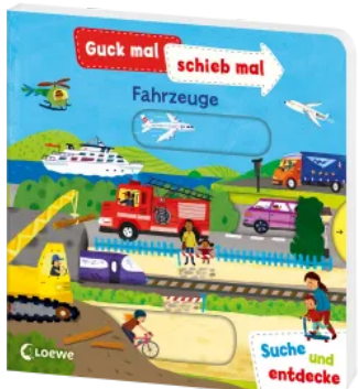
Guck mal, schieb mal! Suche und entdecke - Fahrzeuge Hardcover