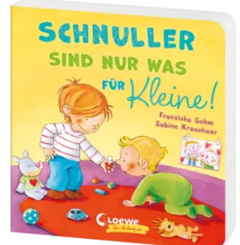
Schnuller sind nur was für Kleine! Hardcover