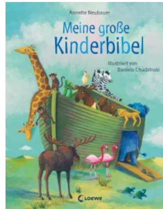
Meine große Kinderbibel Hardcover