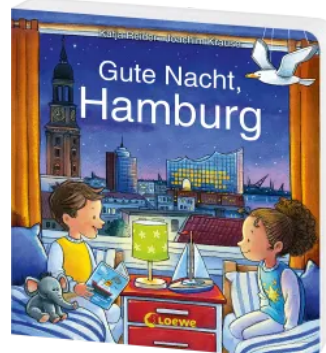
Gute Nacht, Hamburg Hardcover