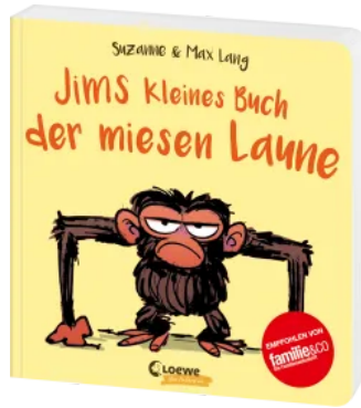
Jims kleines Buch der miesen Laune Hardcover