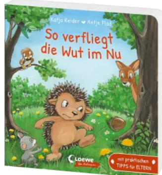
So verfliegt die Wut im Nu Hardcover