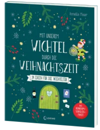
Mit unserem Wichtel durch die Weihnachtszeit Taschenbuch