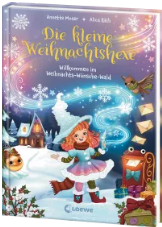
Die kleine Weihnachtshexe (Band 1) - Willkommen im Weihnachts-Wünsche-Wald Hardcover