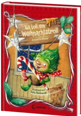
Na toll, ein Weihnachtstroll (Band 1) Hardcover