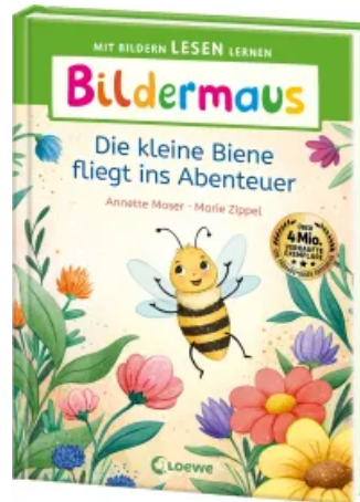
Bildermaus - Die kleine Biene fliegt ins Abenteuer Hardcover