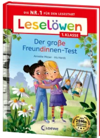
Leselöwen 1. Klasse - Der große Freundinnen-Test Hardcover