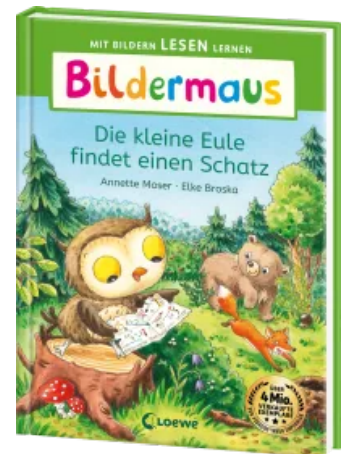
Bildermaus - Die kleine Eule findet einen Schatz Hardcover