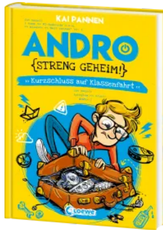
Andro, streng geheim! (Band 3) - Kurzschluss auf Klassenfahrt Hardcover