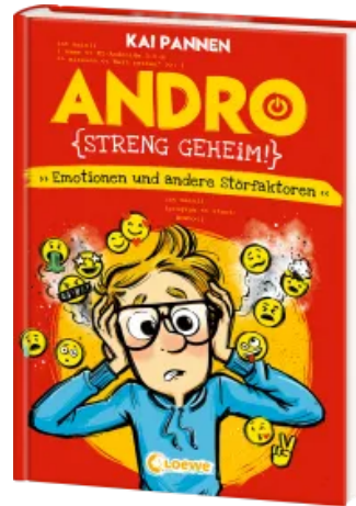
Andro, streng geheim! (Band 2) - Emotionen und andere Störfaktoren Hardcover