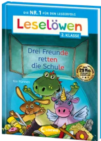
Leselöwen 2. Klasse - Drei Freunde retten die Schule Hardcover