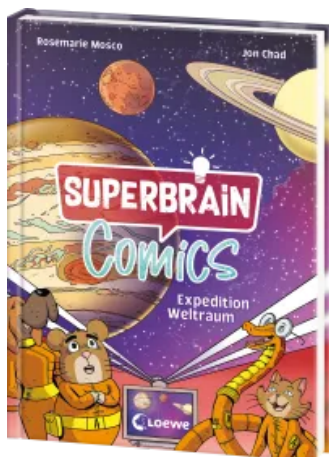
Superbrain-Comics - Expedition Weltraum Hardcover