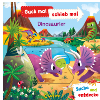
Guck mal, schieb mal! Suche und entdecke - Dinosaurier Hardcover