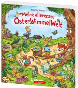
Meine allererste OsterWimmelWelt Hardcover