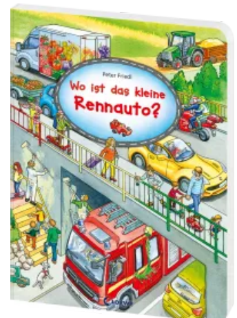
Wo ist das kleine Rennauto? Hardcover