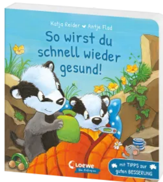
So wirst du schnell wieder gesund! Hardcover