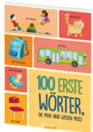
100 erste Wörter, die mein Kind wissen muss Hardcover