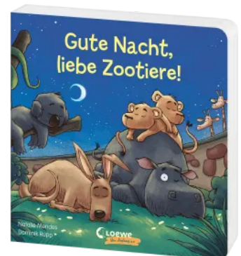
Gute Nacht, liebe Zootiere! Hardcover