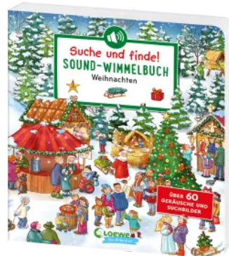
Suche und finde! Sound- Wimmelbuch - Weihnachten Hardcover