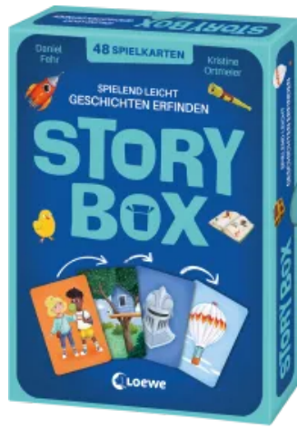
Story Box - Spielend leicht Geschichten erfinden Sonderausgabe