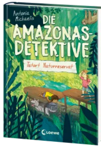
Die Amazonas-Detektive (Band 2) - Tatort Naturreservat Hardcover