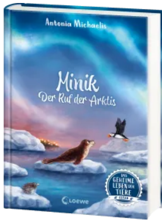
Das geheime Leben der Tiere (Ozean) - Minik - Der Ruf der Arktis Hardcover