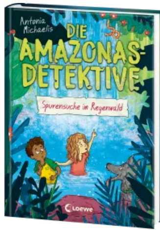
Die Amazonas-Detektive (Band 3) - Spurensuche im Regenwald Hardcover