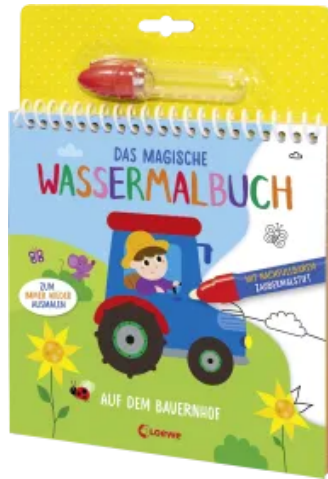
Das magische Wassermalbuch - Auf dem Bauernhof Hardcover