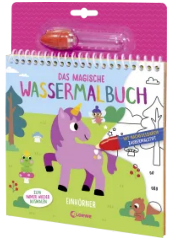
Das magische Wassermalbuch - Einhörner Hardcover