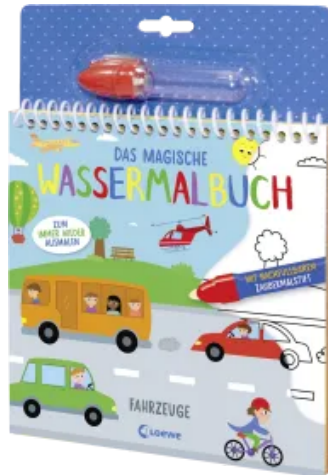
Das magische Wassermalbuch - Fahrzeuge Hardcover