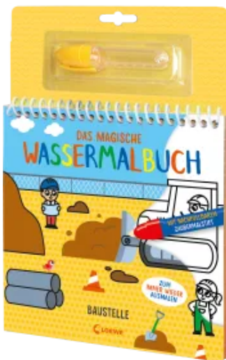
Das magische Wassermalbuch - Baustelle Hardcover