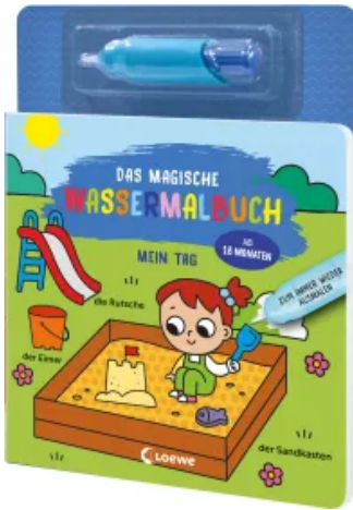
Das magische Wassermalbuch - Mein Tag Hardcover