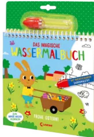
Das magische Wassermalbuch - Frohe Ostern! Hardcover