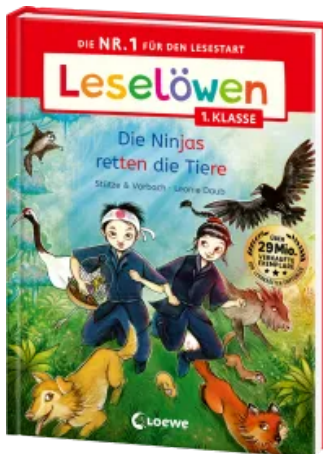
Leselöwen 1. Klasse - Die Ninjas retten die Tiere Hardcover