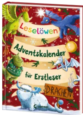
Leselöwen- Adventskalender für Erstleser - Drachen Hardcover