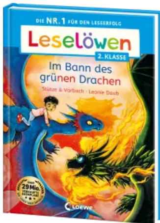
Leselöwen 2. Klasse - Im Bann des grünen Drachen Hardcover