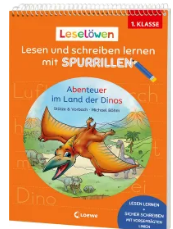
Leselöwen - Lesen und schreiben lernen mit Spurrillen - Abenteuer im Land der Dinos Taschenbuch