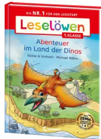
Leselöwen 1. Klasse - Abenteuer im Land der Dinos Hardcover