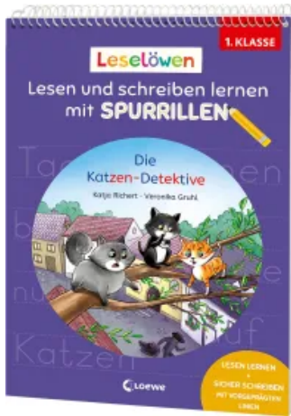
Leselöwen - Lesen und schreiben lernen mit Spurrillen - Die Katzen-Detektive Taschenbuch