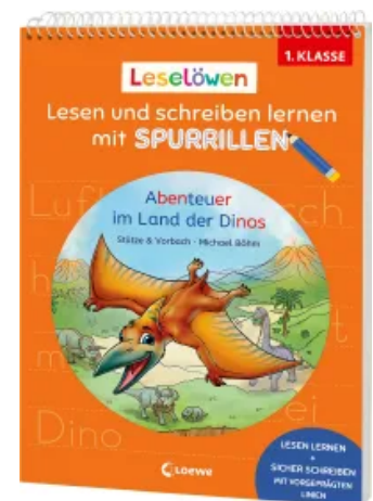
Leselöwen - Lesen und schreiben lernen mit Spurrillen - Abenteuer im Land der Dinos Taschenbuch