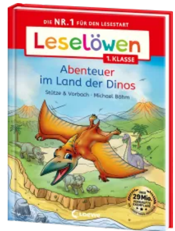
Leselöwen 1. Klasse - Abenteuer im Land der Dinos Hardcover