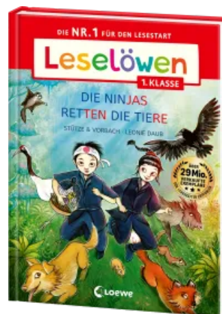
Leselöwen 1. Klasse - Die Ninjas retten die Tiere (Großbuchstabenausgabe) Hardcover