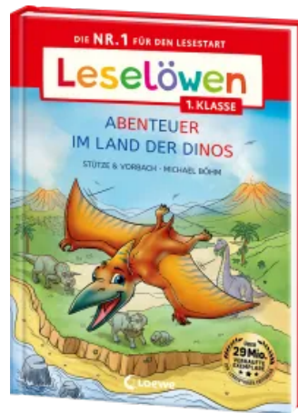
Leselöwen 1. Klasse - Abenteuer im Land der Dinos Hardcover