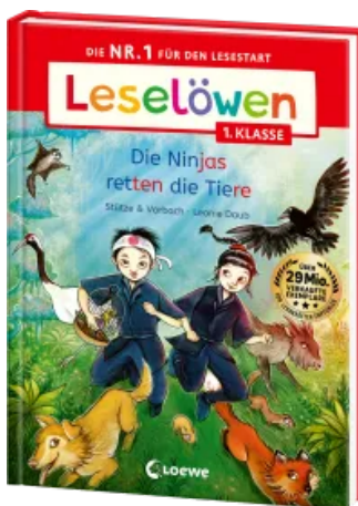
Leselöwen 1. Klasse - Die Ninjas retten die Tiere Hardcover