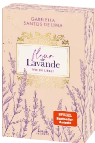
Fleur de Lavande (Band 1) - Wie du liebst Paperback