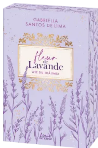
Fleur de Lavande (Band 3) - Wie du träumst Paperback