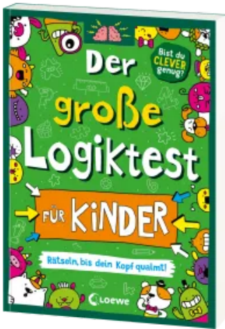
Der große Logiktest für Kinder - Rätseln, bis dein Kopf qualmt! Taschenbuch