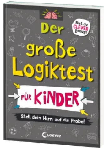
Der große Logiktest für Kinder - Stell dein Hirn auf die Probe! Taschenbuch