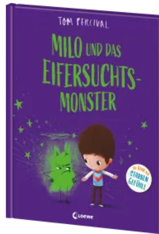
Milo und das Eifersuchtsmonster (Die Reihe der starken Gefühle) Hardcover