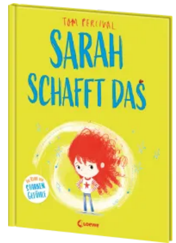
Sarah schafft das (Die Reihe der starken Gefühle) Hardcover