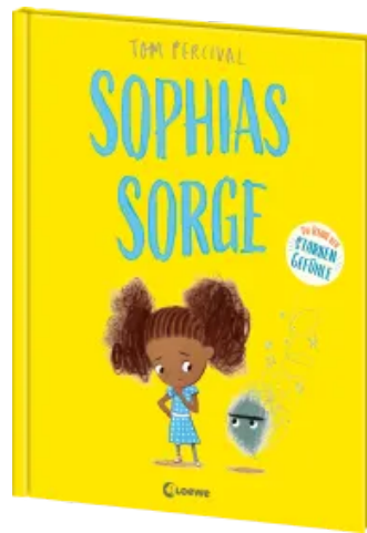
Sophas Sorge (Die Reihe der starken Gefühle) Hardcover