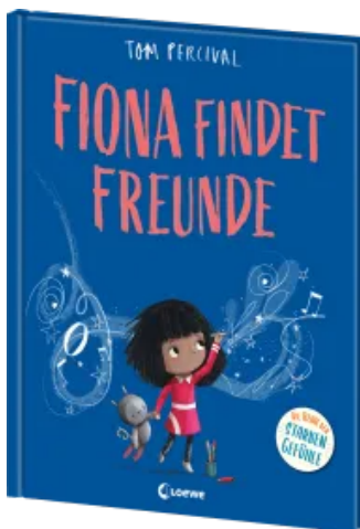
Fiona findet Freunde (Die Reihe der starken Gefühle) Hardcover