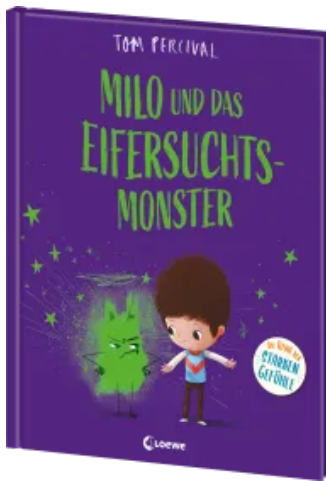
Milo und das Eifersuchtsmonster (Die Reihe der starken Gefühle) Hardcover