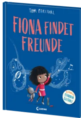
Fiona findet Freunde (Die Reihe der starken Gefühle) Hardcover