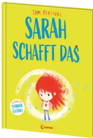
Sarah schafft das (Die Reihe der starken Gefühle) Hardcover