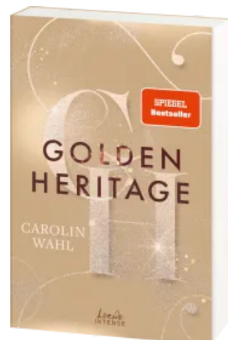
Golden Heritage (Crumbling Hearts, Band 2) Paperback