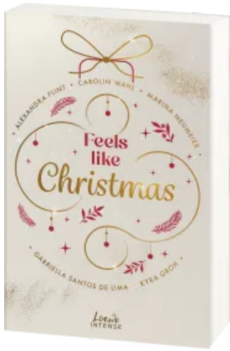
Feels like Christmas Paperback