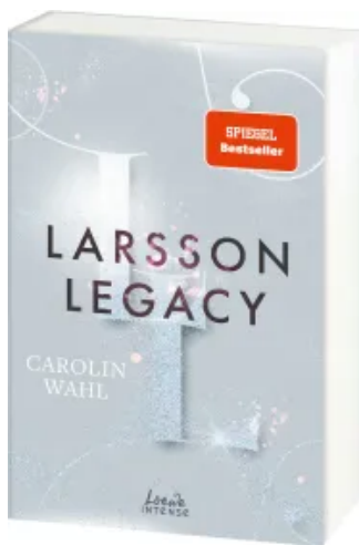
Larsson Legacy (Crumbling Hearts, Band 3) Paperback