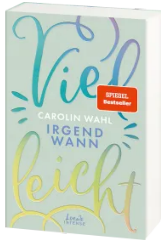
Vielleicht irgendwann (Vielleicht-Trilogie, Band 3) Paperback