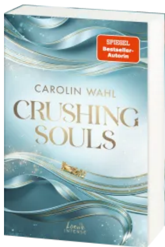
Crushing Souls (Driven Dreams-Dilogie, Band 1) Paperback