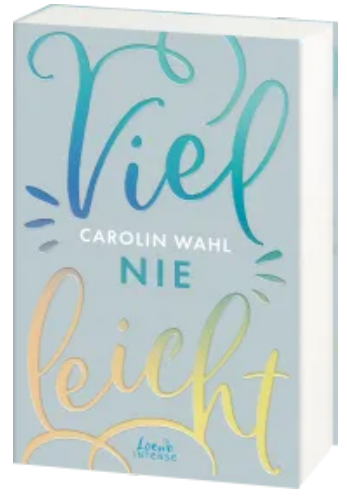
Vielleicht nie (Vielleicht- Trilogie, Band 2) Paperback