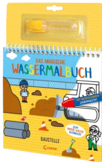
Das magische Wassermalbuch - Baustelle Hardcover