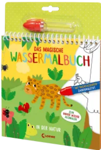
Das magische Wassermalbuch - In der Natur Hardcover