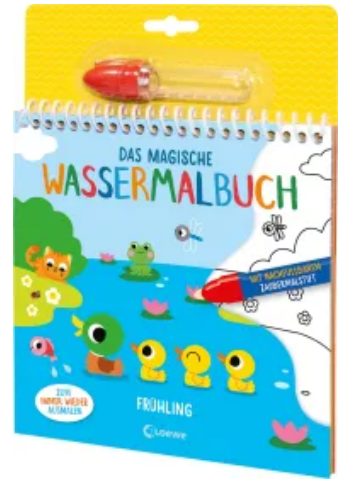
Das magische Wassermalbuch - Frühling Hardcover