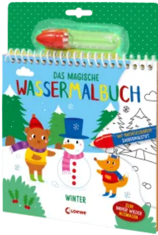
Das magische Wassermalbuch - Winter Hardcover