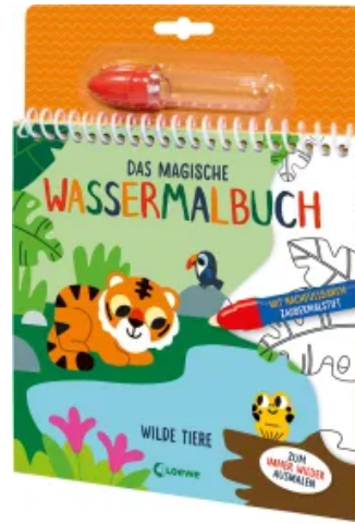
Das magische Wassermalbuch - Wilde Tiere Hardcover