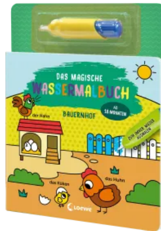
Das magische Wassermalbuch - Bauernhof Hardcover