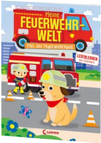
Meine Feuerwehr-Welt - Max, der Feuerwehrrhund Taschenbuch