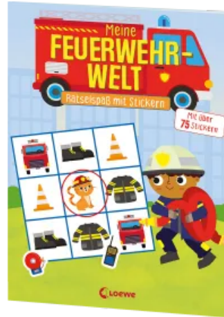
Meine Feuerwehr-Welt - Rätselspaß mit Stickers Taschenbuch