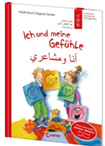
Ich und meine Gefühle - Deutsch - Arabisch (Starke Kinder, glückliche Eltern) Hardcover