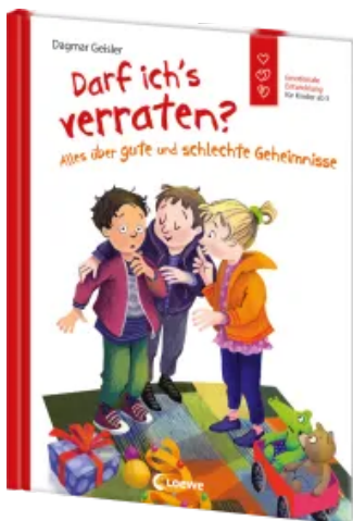
Darf ich's verraten? Alles über gute und schlechte Geheimnisse Hardcover