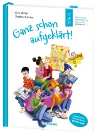
Ganz schön aufgeklärt! Hardcover