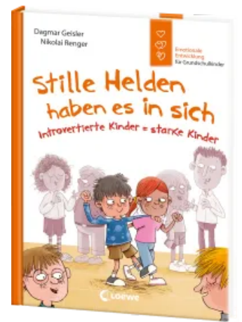
Stille Helden haben es in sich (Starke Kinder, glückliche Eltern) Hardcover