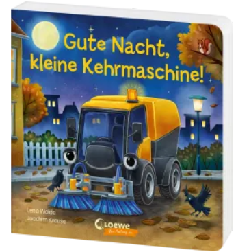
Gute Nacht, kleine Kehrmaschine! Hardcover