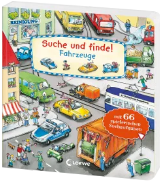
Suche und finde! - Fahrzeuge Hardcover