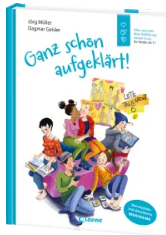
Ganz schön aufgeklärt! Hardcover