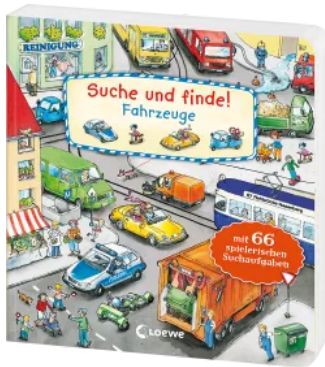
Suche und finde! - Fahrzeuge Hardcover