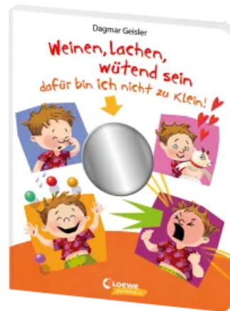
Weinen, lachen, wütend sein - dafür bin ich nicht zu klein! Hardcover