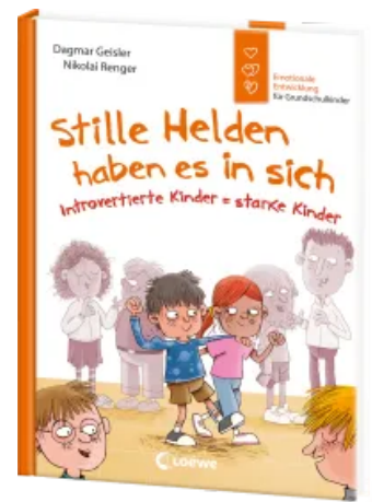
Stille Helden haben es in sich (Starke Kinder, glückliche Eltern) Hardcover