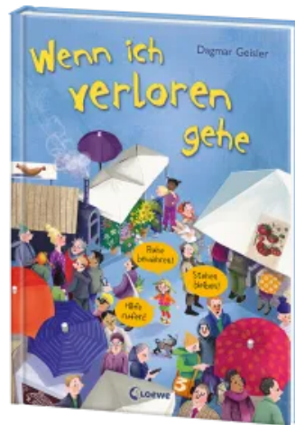
Wenn ich verloren gehe (Starke Kinder, glückliche Eltern) Hardcover