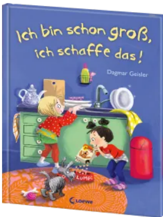
Ich bin schon groß, ich schaffe das! Hardcover