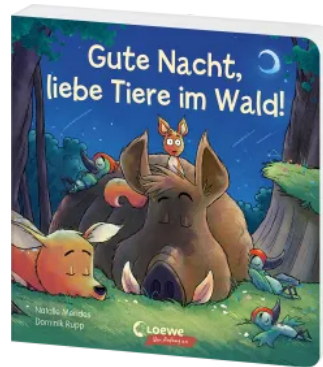
Gute Nacht, liebe Tiere im Wald! Hardcover