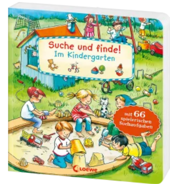
Suche und finde! - Im Kindergarten Hardcover