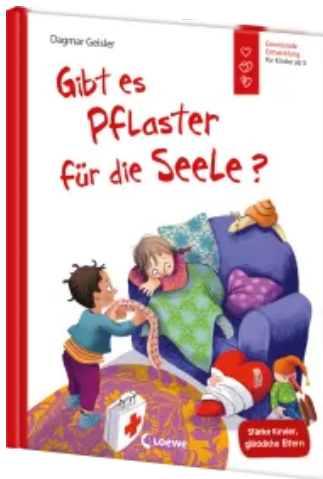
Gibt es Pflaster für die Seele? (Starke Kinder, glückliche Eltern) Hardcover