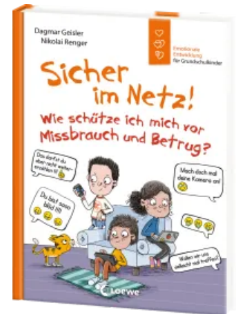
Sicher im Netz! Wie schütze ich mich vor Missbrauch und Betrug? (Starke Kinder, glückliche Eltern) Hardcover