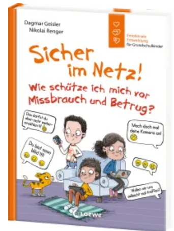
Sicher im Netz! Wie schütze ich mich vor Missbrauch und Betrug? (Starke Kinder, glückliche Eltern) Hardcover