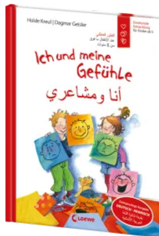
Ich und meine Gefühle - Deutsch - Arabisch (Starke Kinder, glückliche Eltern) Hardcover