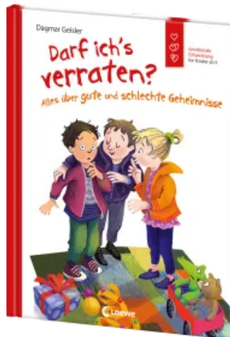
Darf ich's verraten? Alles über gute und schlechte Geheimnisse Hardcover