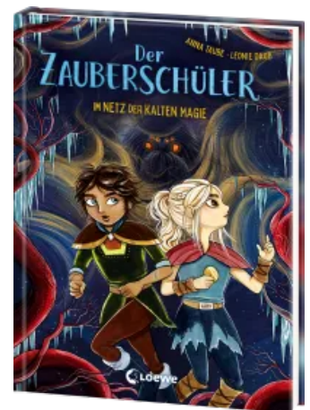
Der Zauberschüler (Band 8) - Im Netz der kalten Magie Hardcover