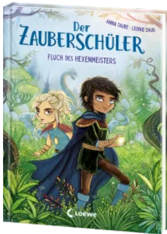
Der Zauberschüler (Band 1) - Fluch des Hexenmeisters Hardcover