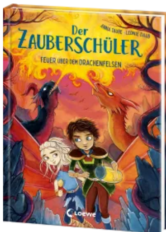
Der Zauberschüler (Band 6) - Feuer über dem Drachenfelsen Hardcover