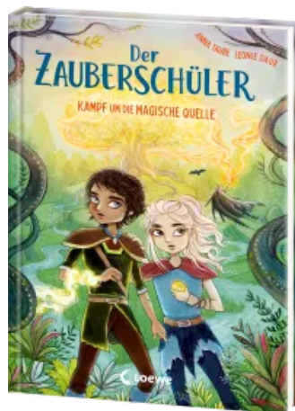
Der Zauberschüler (Band 4) - Kampf um die Magische Quelle Hardcover