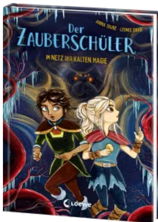
Der Zauberschüler (Band 8) - Im Netz der kalten Magie Hardcover