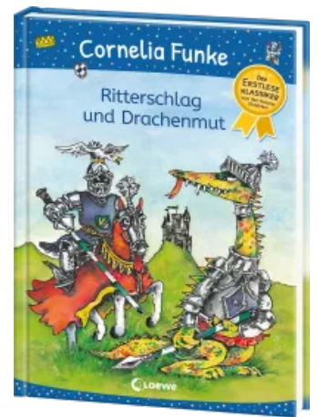
Ritterschlag und Drachenmut Hardcover