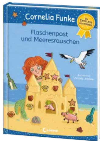
Flaschenpost und Meeresrauschen Hardcover