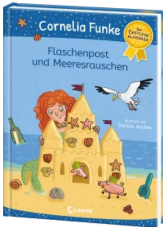
Flaschenpost und Meeresrauschen Hardcover