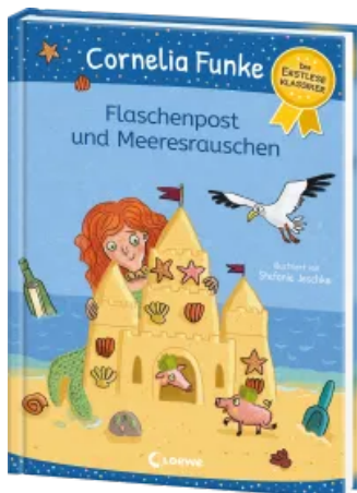
Flaschenpost und Meeresrauschen Hardcover