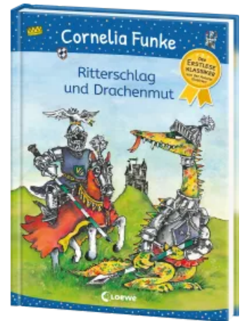
Ritterschlag und Drachenmut Hardcover