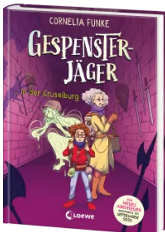
Gespenssterjäger in der Gruselburg (Band 3) - Mit 8 neu illustrierten Farbseiten Hardcover