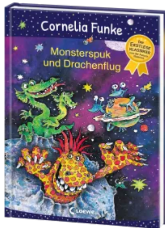
Monsterspuk und Drachenflug Hardcover