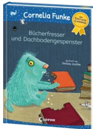
Bücherfresser und Dachbodengespenster Hardcover