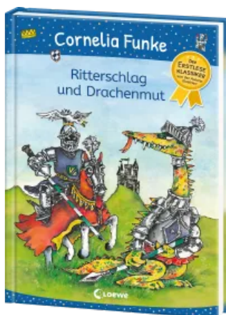
Ritterschlag und Drachenmut Hardcover