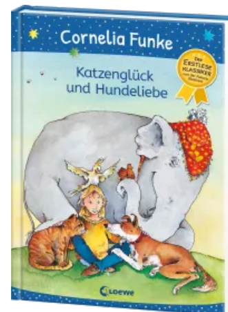
Katzensglück und Hundeliebe Hardcover