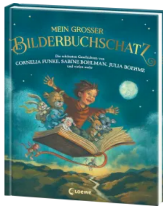
Mein großer Bilderbuchschatz Hardcover