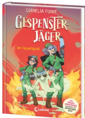
Gespenssterjäger im Feuerspuk (Band 2) - Mit 8 neu illustrierten Farbseiten Hardcover