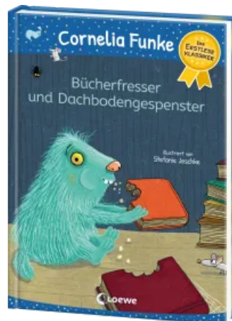
Bücherfresser und Dachbodengespenster Hardcover