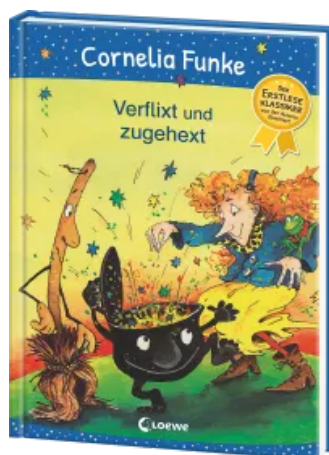
Verflüxt und zugehext Hardcover