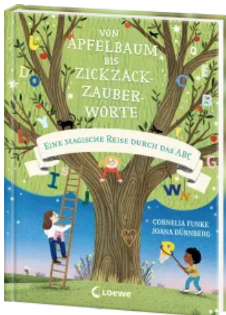
Von Apfelbaum bis Zickzackzauberworte Hardcover