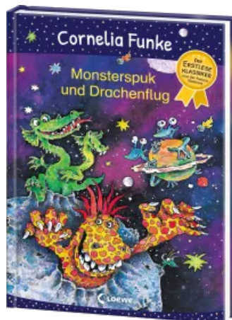
Monsterspuk und Drachenflug Hardcover