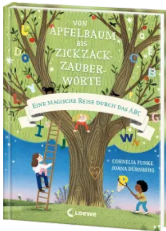
Von Apfelbaum bis Zickzackzauberworte Hardcover