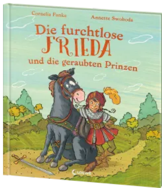
Die furchtlose Frieda und die geraubten Prinzen Hardcover