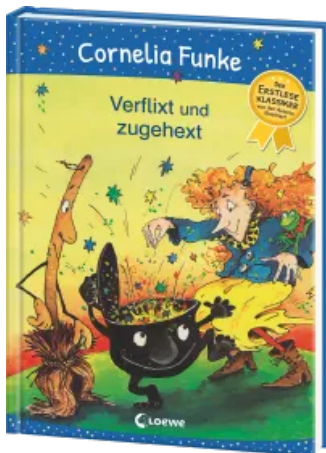
Verflixt und zugehext Hardcover