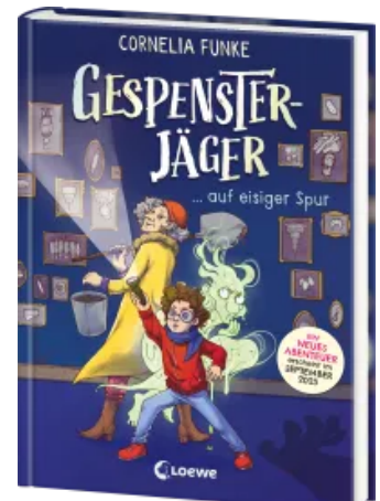
Gespensterjäger auf eisiger Spur (Band 1) - Mit 8 neu illustrierten Farbseiten Hardcover