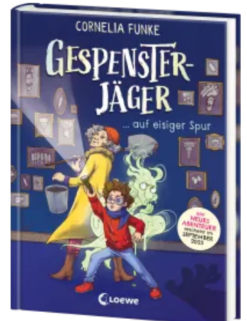
Gespenssterjäger auf eisiger Spur (Band 1) - Mit 8 neu illustrierten Farbseiten Hardcover