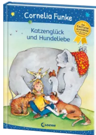
Katzenglück und Hundeliebe Hardcover