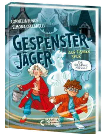
Gespensterjäger auf eisiger Spur (Band 1) - Die Graphic Novel Hardcover