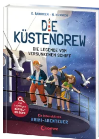
Die Küstencrew (Band 4) - Die Legende vom versunkenen Schiff Hardcover