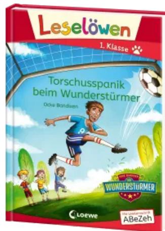
Leselöwen 1. Klasse - Torschusspanik beim Wunderstürmer Hardcover