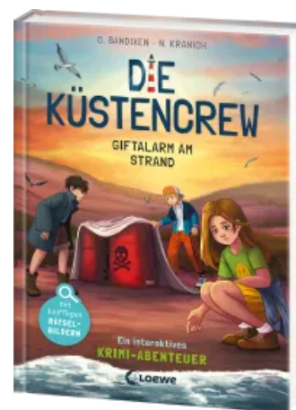
Die Küstencrew (Band 5) - Giftalarm am Strand Hardcover