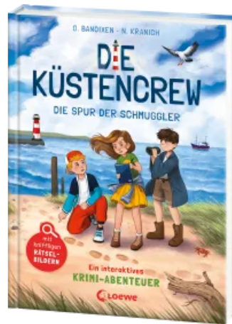
Die Küstencrew (Band 2) - Die Spur der Schmuggler Hardcover