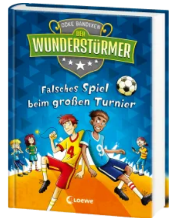
Der Wunderstürmer (Band 7) - Falsches Spiel beim großen Turnier Hardcover