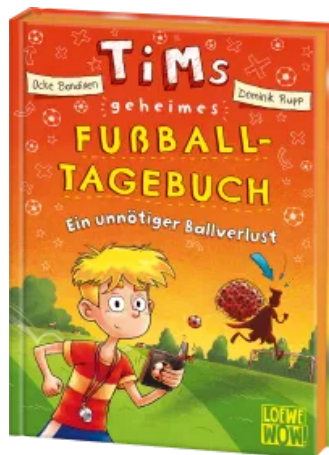
Tims geheimes Fußball- Tagebuch (Band 2) - Ein unnötiger Ballverlust Hardcover