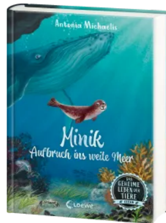
Das geheime Leben der Tiere (Ozean) - Minik - Aufbruch ins weite Meer Hardcover