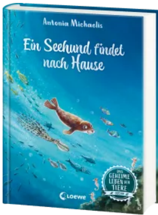
Das geheime Leben der Tiere (Ozean) - Ein Seehund findet nach Hause Hardcover