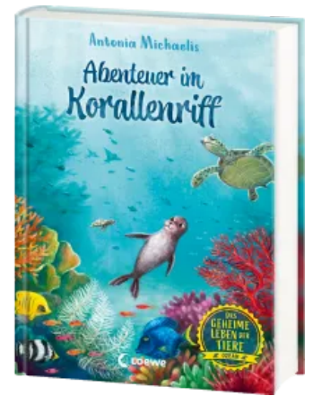
Das geheime Leben der Tiere (Ozean) - Abenteuer im Korallenriff Hardcover