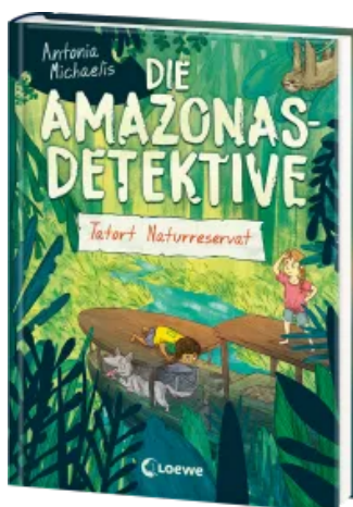
Die Amazonas-Detektive (Band 2) - Tatort Naturreservat Hardcover