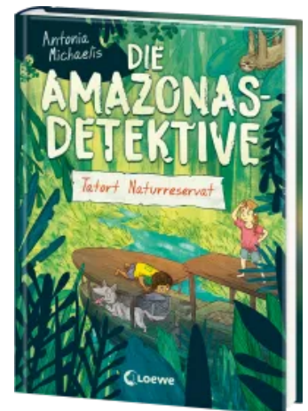
Die Amazonas-Detektive (Band 2) - Tatort Naturreservat Hardcover