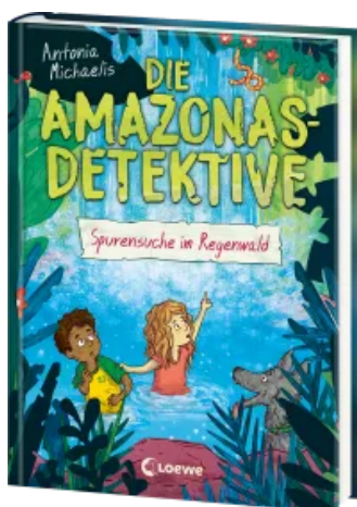
Die Amazonas-Detektive (Band 3) - Spurensuche im Regenwald Hardcover