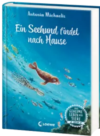
Das geheime Leben der Tiere (Ozean) - Ein Seehund findet nach Hause Hardcover