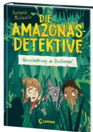
Die Amazonas-Detektive (Band 1) - Verschwörung im Dschungel Hardcover