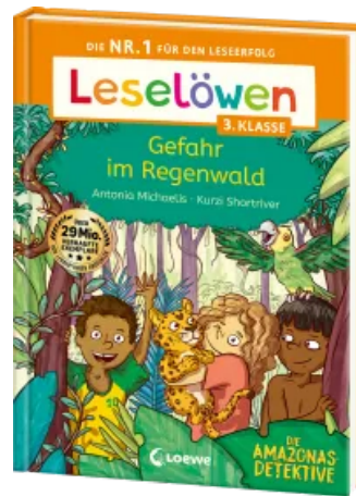
Leselöwen 3. Klasse - Amazonas-Detektive: Gefahr im Regenwald Hardcover