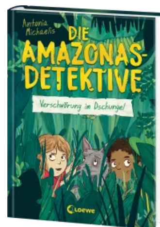
Die Amazonas-Detektive (Band 1) - Verschwörung im Dschungel Hardcover