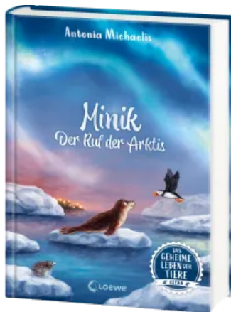
Das geheime Leben der Tiere (Ozean) - Minik - Der Ruf der Arktis Hardcover