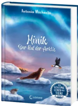
Das geheime Leben der Tiere (Ozean) - Minik - Der Ruf der Arktis Hardcover