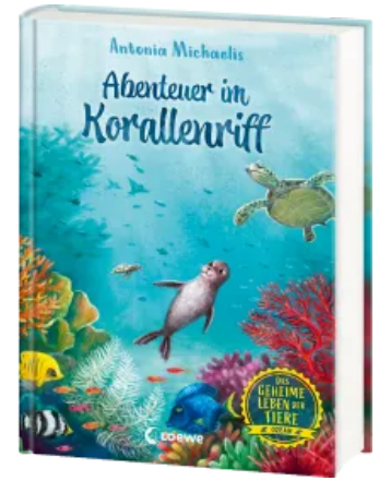
Das geheime Leben der Tiere (Ozean) - Abenteuer im Korallenriff Hardcover