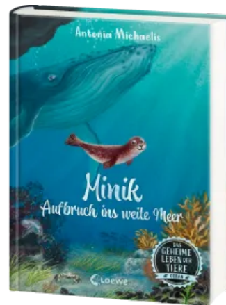
Das geheime Leben der Tiere (Ozean) - Minik - Aufbruch ins weite Meer Hardcover