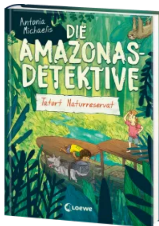
Die Amazonas-Detektive (Band 2) - Tatort Naturreservat Hardcover