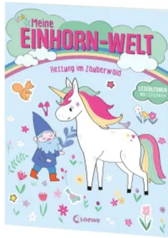
Meine Einhorn-Welt - Rettung im Zauberwald Taschenbuch