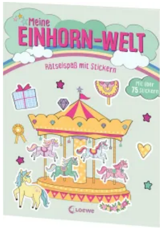
Meine Einhorn-Welt - Rätselspaß mit Stickern Taschenbuch