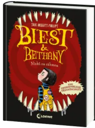
Biest & Bethany (Band 1) - Nicht zu zähmen Hardcover