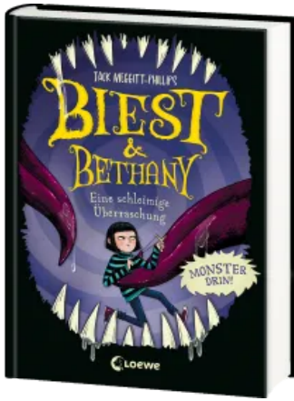
Biest & Bethany (Band 3) - Eine schleimige Überraschung Hardcover