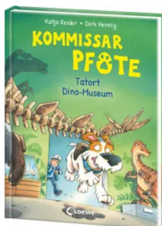
Kommissar Pfote (Band 9) - Tatort Dino-Museum Hardcover