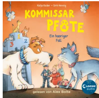
Kommissar Pfote (Band 4) - Ein haariger Fall Hörbuch