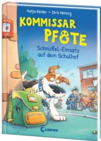
Kommissar Pfote (Band 3) - Schnüffel-Einsatz auf dem Schulhof Hardcover