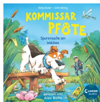
Kommissar Pfote (Band 7) - Spurensuche am Waldsee Hörbuch