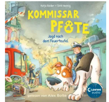
Kommissar Pfote (Band 8) - Jagd nach dem Feuerteufel Hörbuch