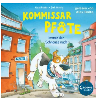
Kommissar Pfote (Band 1) - Immer der Schnauze nach Hörbuch