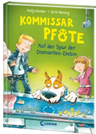
Kommissar Pfote (Band 2) - Auf der Spur der Diamanten-Diebin Hardcover