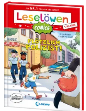
Leselöwen Comics 1. Klasse - Plötzlich Polizist! Hardcover