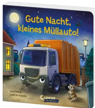
Gute Nacht, kleines Müllauto! Hardcover