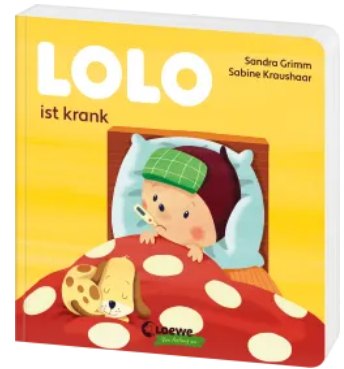
Lolo ist krank Hardcover