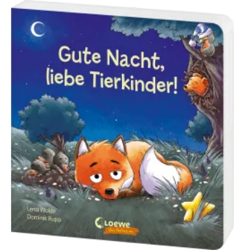
Gute Nacht, liebe Tierkinder! Hardcover