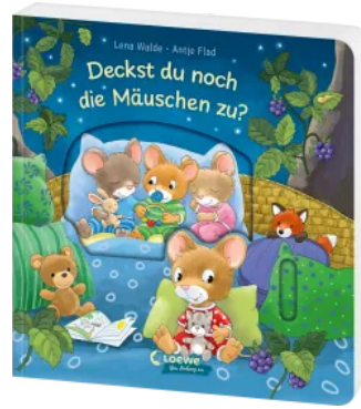
Deckst du noch die Mäuschen zu? Hardcover