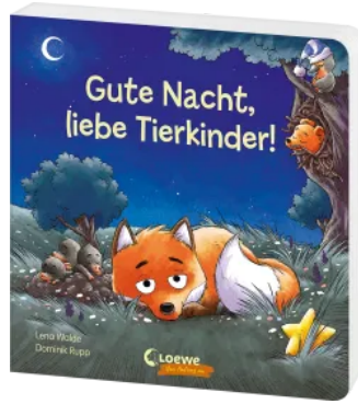
Gute Nacht, liebe Tierkinder! Hardcover