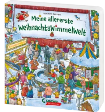
Meine allererste WeihnachtsWimmelWelt Hardcover