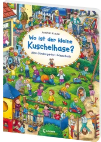
Wo ist der kleine Kuschelhase? Hardcover