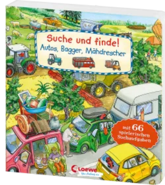
Suche und finde! - Autos, Bagger, Mähdrescher Hardcover