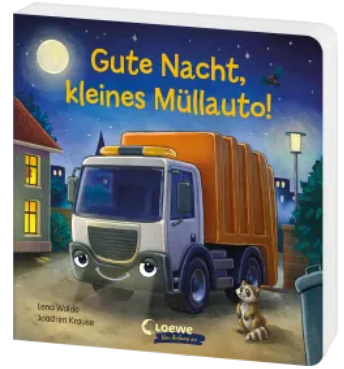
Gute Nacht, kleines Müllauto! Hardcover