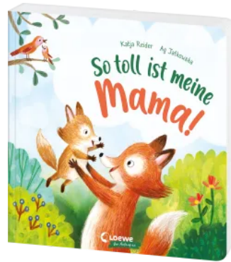
So toll ist meine Mama! Hardcover