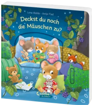
Deckst du noch die Mäuschen zu? Hardcover