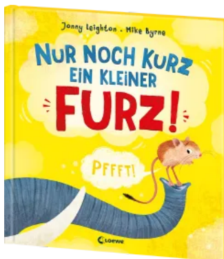
Nur noch kurz ein kleiner Furz! Hardcover