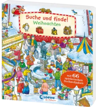
Suche und finde! - Weihnachten Hardcover