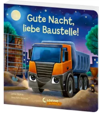
Gute Nacht, liebe Baustelle! Hardcover