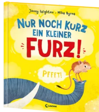
Nur noch kurz ein kleiner Furz! Hardcover