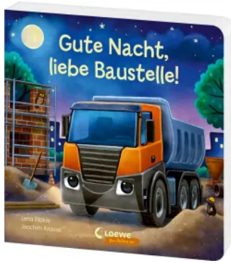
Gute Nacht, liebe Baustelle! Hardcover