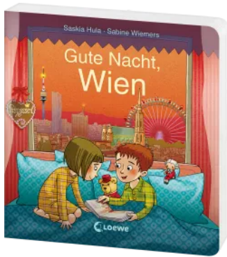
Gute Nacht, Wien Hardcover