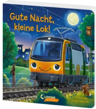
Gute Nacht, kleine Lok! Hardcover