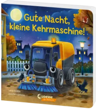
Gute Nacht, kleine Kehrmaschine! Hardcover