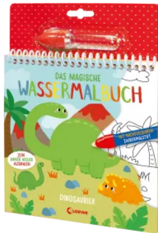
Das magische Wassermalbuch - Dinosaurier Hardcover