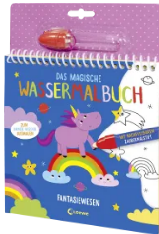
Das magische Wassermalbuch - Fantasiewesen Hardcover