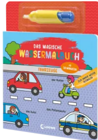
Das magische Wassermalbuch - Fahrzeuge Hardcover