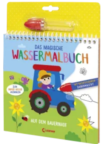
Das magische Wassermalbuch - Auf dem Bauernhof Hardcover