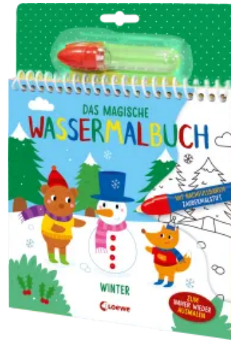
Das magische Wassermalbuch - Winter Hardcover