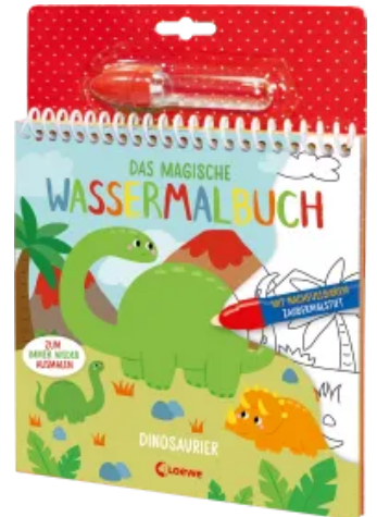
Das magische Wassermalbuch - Dinosaurier Hardcover