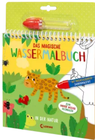
Das magische Wassermalbuch - In der Natur Hardcover