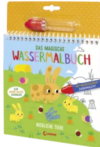
Das magische Wassermalbuch - Niedliche Tiere Hardcover