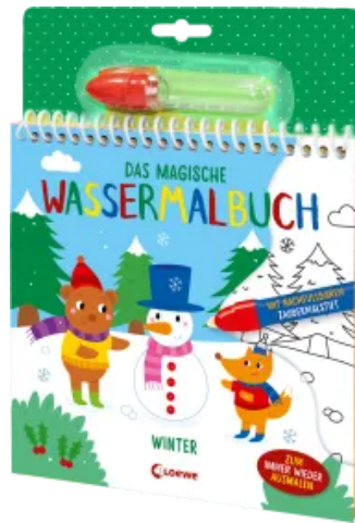
Das magische Wassermalbuch - Winter Hardcover