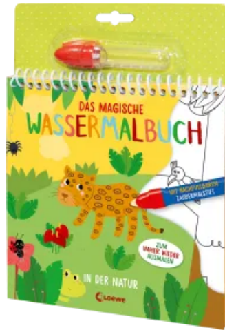
Das magische Wassermalbuch - In der Natur Hardcover