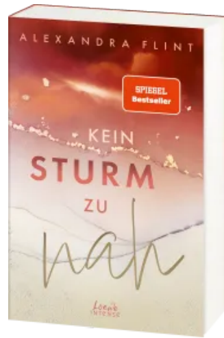
Kein Sturm zu nah (Tales of Sylt, Band 2) Paperback