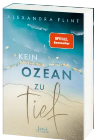
Kein Ozean zu tief (Tales of Sylt, Band 3)