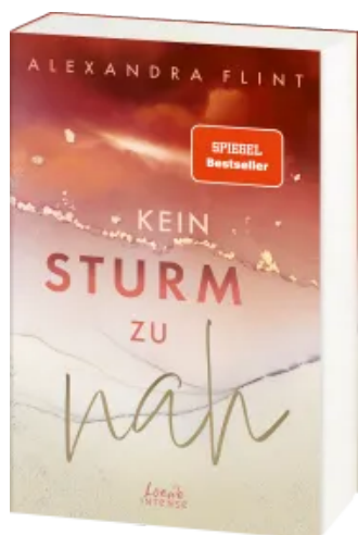
Kein Sturm zu nah (Tales of Sylt, Band 2)