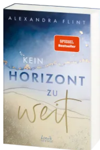
Kein Horizont zu weit (Tales of Sylt, Band 1)