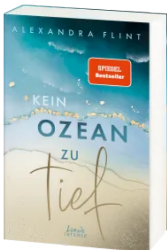
Kein Ozean zu tief (Tales of Sylt, Band 3)