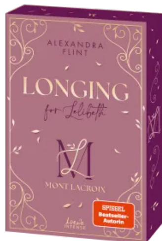
Mont Lacroix (Band 1) - Longing for Lelibeth