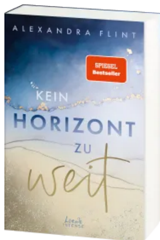
Kein Horizont zu weit (Tales of Sylt, Band 1)