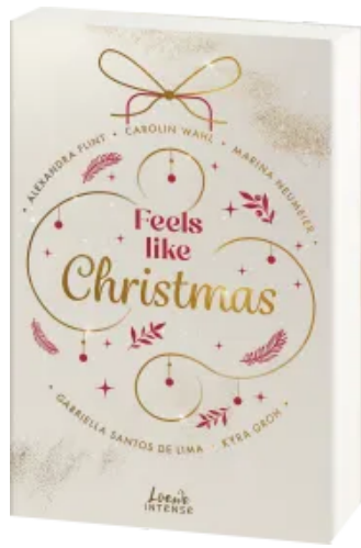
Feels like Christmas Paperback