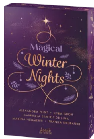
Magical Winter Nights