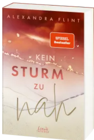
Kein Sturm zu nah (Tales of Sylt, Band 2)