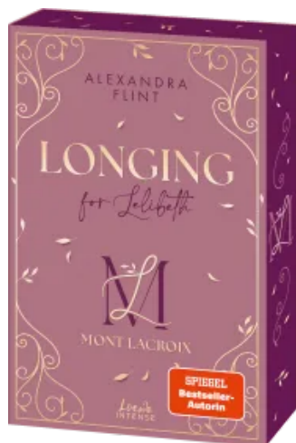
Mont Lacroix (Band 1) - Longing for Lelibeth