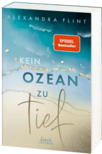
Kein Ozean zu tief (Tales of Sylt, Band 3) Paperback