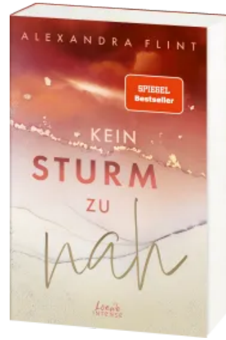
Kein Sturm zu nah (Tales of Sylt, Band 2) Paperback