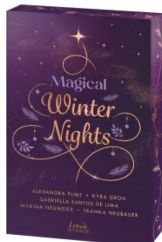
Magical Winter Nights Paperback