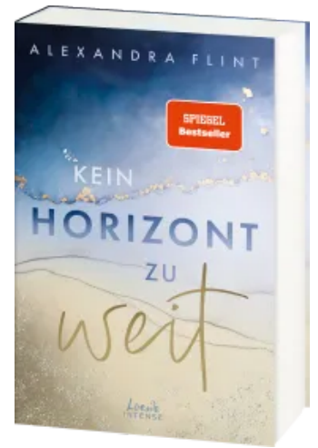
Kein Horizont zu weit (Tales of Sylt, Band 1) Paperback