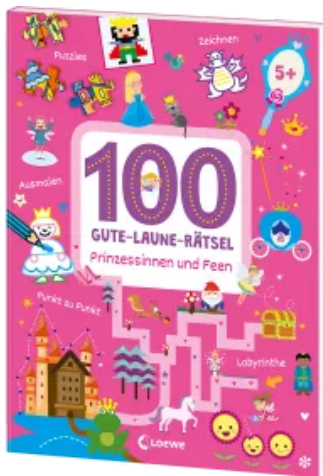
100 Gute-Laune-Rätsel - Prinzessinnen und Feen Taschenbuch