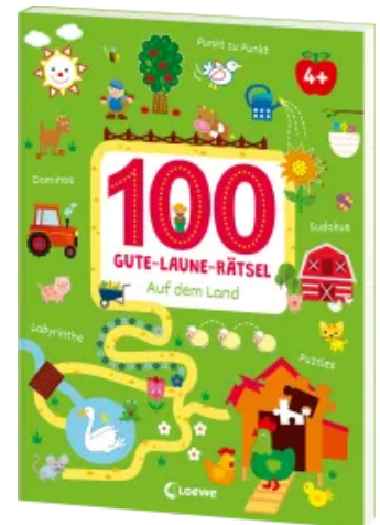
100 Gute-Laune-Rätsel - Auf dem Land Taschenbuch