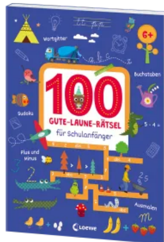
100 Gute-Laune-Rätsel für Schulanfänger Taschenbuch