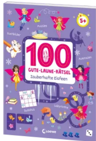
100 Gute-Laune-Rätsel - Zaubhafte Eisfeen Taschenbuch