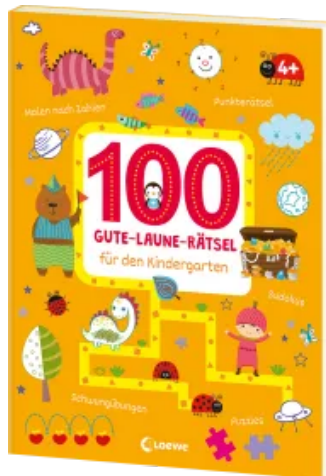
100 Gute-Laune-Rätsel für den Kindergarten Taschenbuch