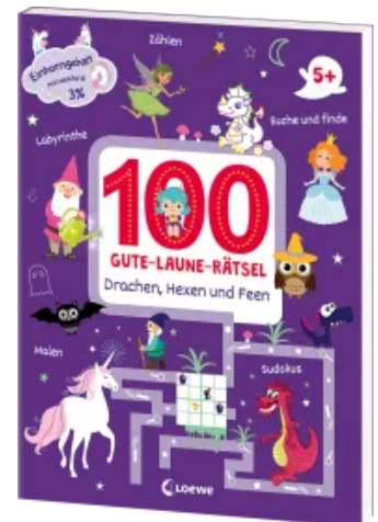
100 Gute-Laune-Rätsel - Drachen, Hexen und Feen Taschenbuch