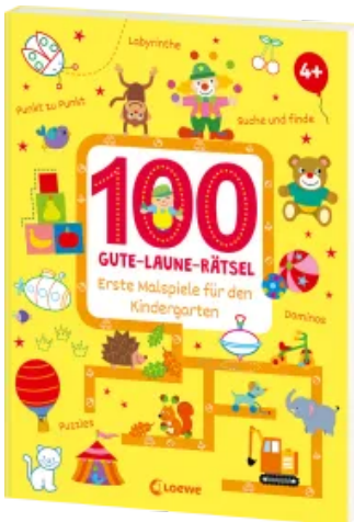
100 Gute-Laune-Rätsel - Erste Malspiele für den Kindergarten Taschenbuch