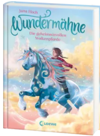
Wundermähne (Band 5) - Die geheimnisvollen Wolkenpferde Hardcover