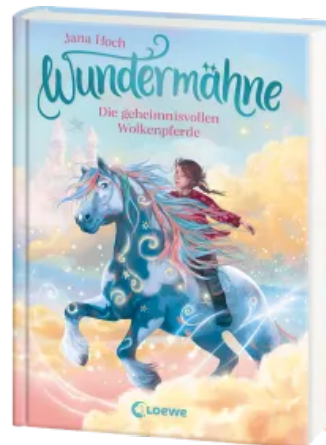
Wundermähne (Band 5) - Die geheimnisvollen Wolkenpferde Hardcover