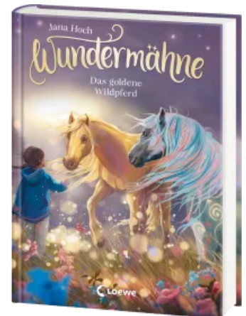
Wundermähne (Band 4) - Das goldene Wildpferd Hardcover