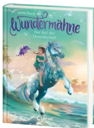
Wundermähne (Band 3) - Der Ruf der Freundschaft Hardcover