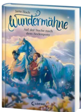
Wundermähne (Band 2) - Auf der Suche nach dem Seelenpony Hardcover