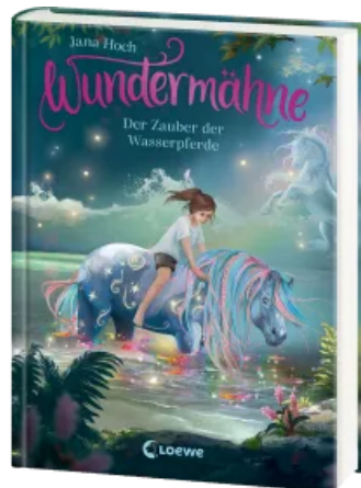
Wundermähne (Band 6) - Der Zauber der Wasserpferde Hardcover