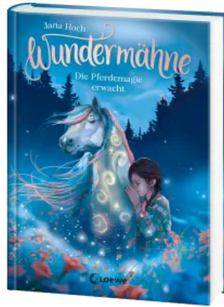
Wundermähne (Band 1) - Die Pferdemaie erwacht Hardcover