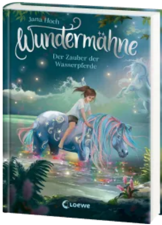
Wundermähne (Band 6) - Der Zauber der Wasserpferde Hardcover