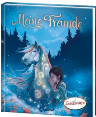
Meine Freunde (Wundermähne) Hardcover