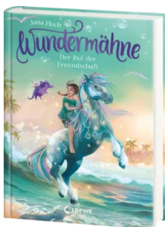
Wundermähne (Band 3) - Der Ruf der Freundschaft Hardcover