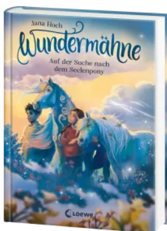
Wundermähne (Band 2) - Auf der Suche nach dem Seelenpony Hardcover