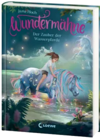
Wundermähne (Band 6) - Der Zauber der Wasserpferde Hardcover