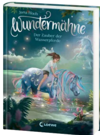
Wundermähne (Band 6) - Der Zauber der Wasserpferde Hardcover