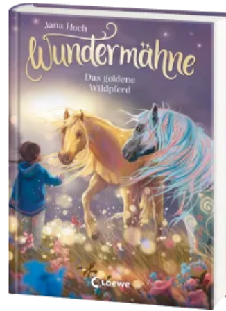
Wundermähne (Band 4) - Das goldene Wildpferd Hardcover