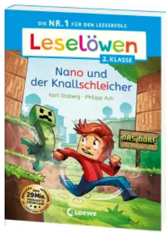
Leselöwen 2. Klasse - Nano und der Knallschleicher Taschenbuch