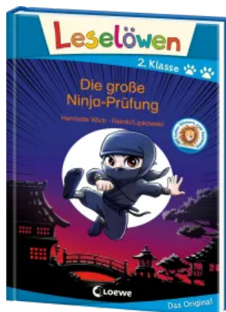
Leselöwen 2. Klasse - Die große Ninja-Prüfung Hardcover