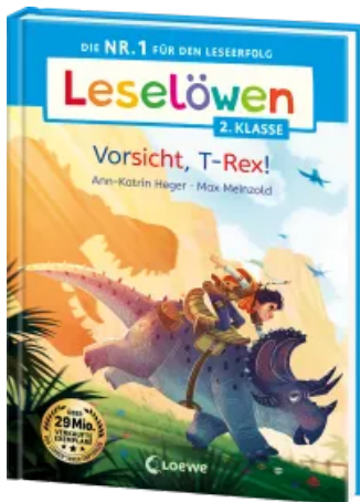
Leselöwen 2. Klasse - Vorsicht, T-Rex! Hardcover