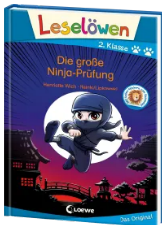
Leselöwen 2. Klasse - Die große Ninja-Prüfung Hardcover