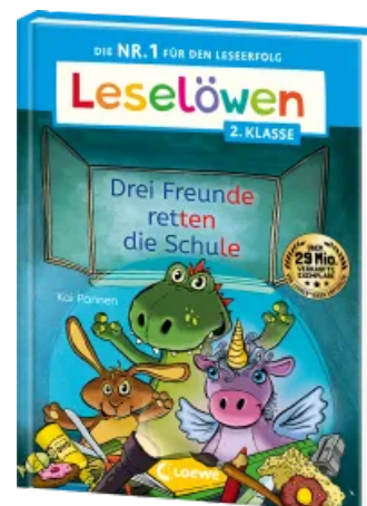
Leselöwen 2. Klasse - Drei Freunde retten die Schule Hardcover