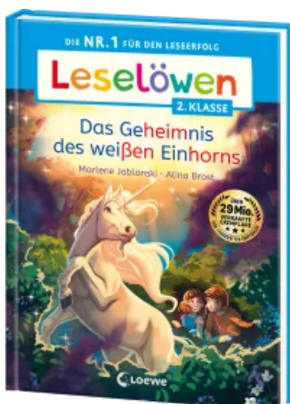
Leselöwen 2. Klasse - Das Geheimnis des weißen Einhorns Hardcover