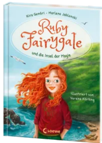
Ruby Fairygale und die Insel der Magie (Erstlese- Reihe, Band 1) Hardcover