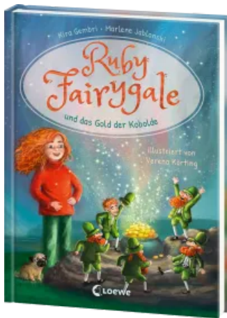
Ruby Fairygale und das Gold der Kobolde (Erstlese- Reihe, Band 3) Hardcover