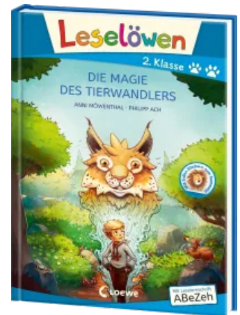
Leselöwen 2. Klasse - Die Magie des Tierwandlers (Großbuchstabenausgabe) Hardcover