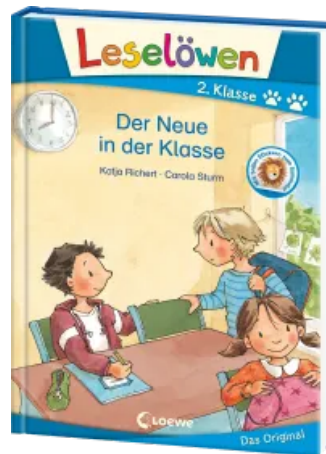
Leselöwen 2. Klasse - Der Neue in der Klasse Hardcover