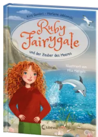
Ruby Fairygale und der Zauber des Meeres (Erstlese-Reihe, Band 5) Hardcover