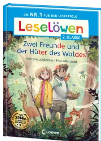
Leselöwen 2. Klasse - Zwei Freunde und der Hüter des Waldes Hardcover