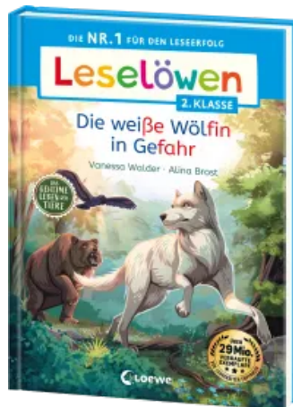
Leselöwen 2. Klasse - Das geheime Leben der Tiere - Die weiße Wölfin in Gefahr Hardcover