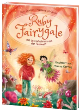
Ruby Fairygale und das Geheimnis aus der Feenwelt (Erstlese-Reihe, Band 2) Hardcover