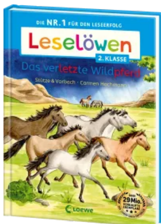
Leselöwen 2. Klasse - Das verletzte Wildpferd Hardcover