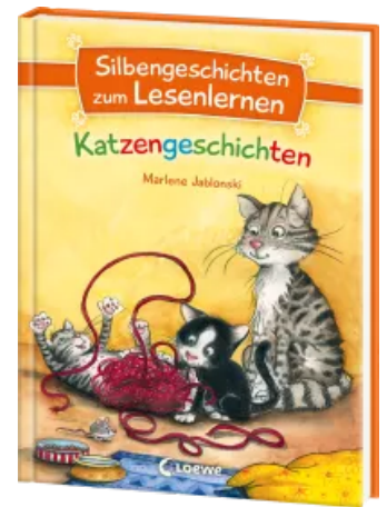
Silbengeschichten zum Lesenlernen - Katzenschichten Hardcover