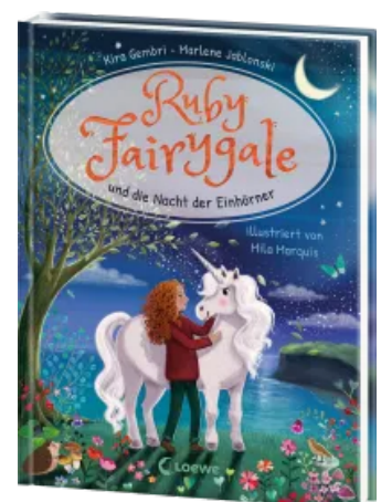
Ruby Fairygale und die Nacht der Einhörner (Erstlese-Reihe, Band 4) Hardcover