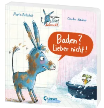
Der kleine Esel Lieber nicht! - Baden? Lieber nicht! Hardcover