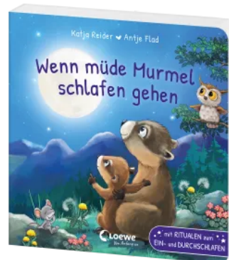
Wenn müde Marmel schlafen gehen Hardcover