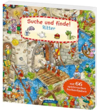
Suche und finde! - Ritter Hardcover