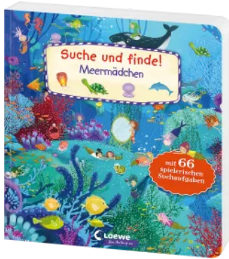
Suche und finde! - Meermädchen Hardcover