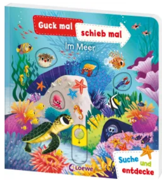
Guck mal, schieb mal! Suche und entdecke - Im Meer Hardcover