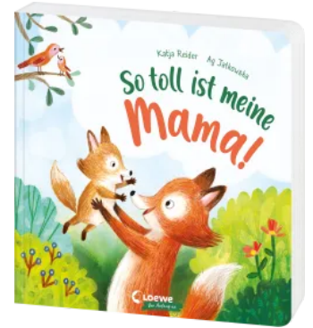
So toll ist meine Mama! Hardcover