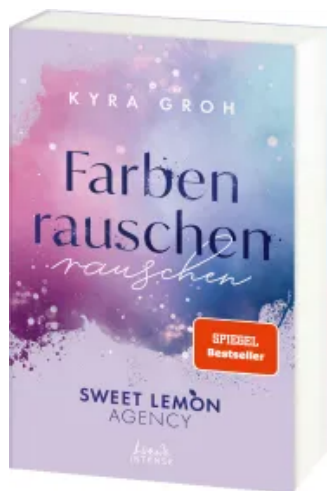
Farbenrauschen (Sweet Lemon Agency, Band 2) Paperback