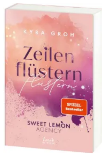
Zeilenflüstern (Sweet Lemon Agency, Band 1) Paperback