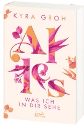
Alles, was ich in dir sehe (Alles-Trilogie, Band 1) Paperback