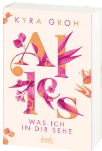
Alles, was ich in dir sehe (Alles-Trilogie, Band 1) Paperback