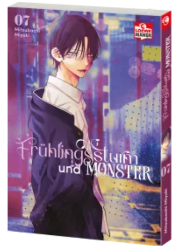
Frühlingssturm und Monster 07 Taschenbuch