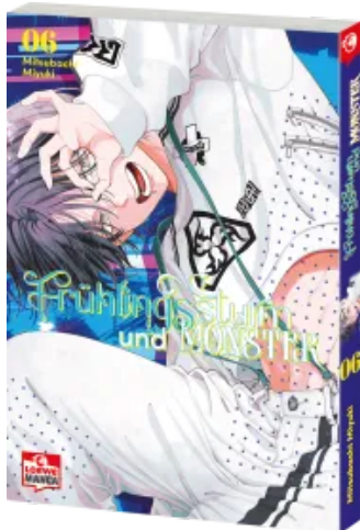
Frühlingssturm und Monster 06 Taschenbuch