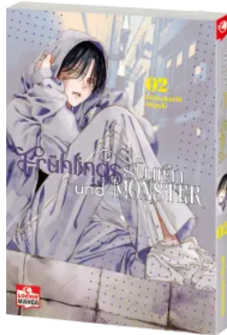
Frühlingssturm und Monster 02 Taschenbuch