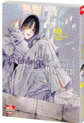
Frühlingssturm und Monster 02 Taschenbuch