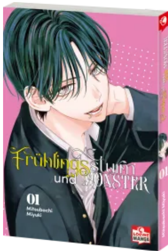
Frühlingssturm und Monster 01 Taschenbuch