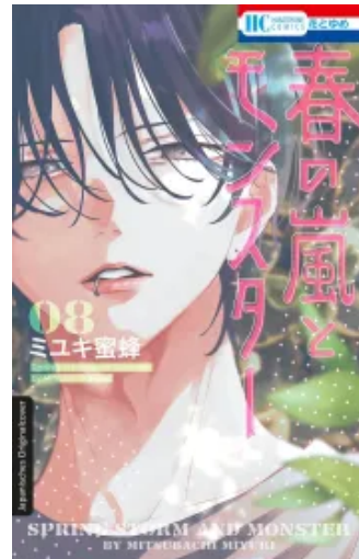
Frühlingssturm und Monster 08 Taschenbuch