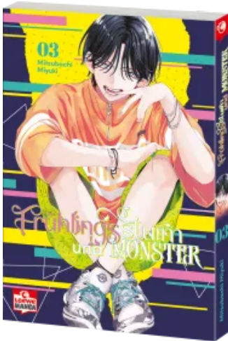
Frühlingssturm und Monster 03 Taschenbuch