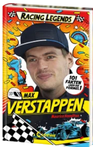
Racing Legends (Band 2) - Max Verstappen Hardcover