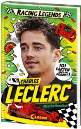
Racing Legends (Band 3) - Charles Leclerc Hardcover