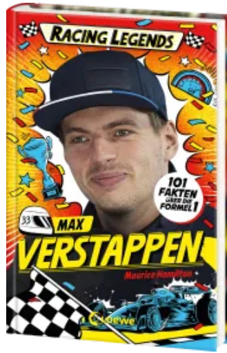
Racing Legends (Band 2) - Max Verstappen Hardcover