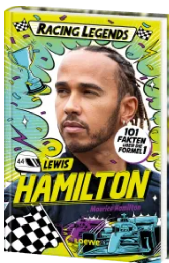
Racing Legends (Band 1) - Lewis Hamilton Hardcover